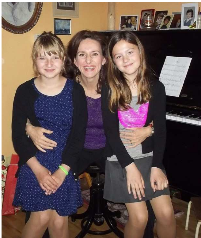
foto z návěku na představení Vodník