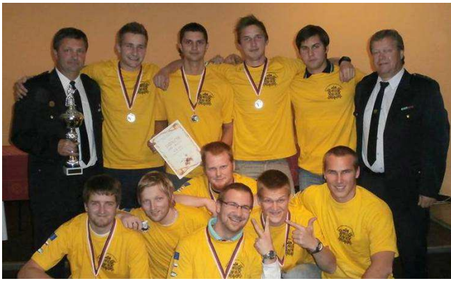
Vyhlášení PHL 2013

Naši členové se podíleli na odstraňování škod po loňských záplavách. Bylo provedeno čištění studny v Měčině v Cihelně, čištění cest v Bílukách a v Měčině, technická pomoc při čištění koupaliště v Petrovicích a čištění kanalizace v Malinci. Dále jsme zavlažovali hřiště v Bílukách.