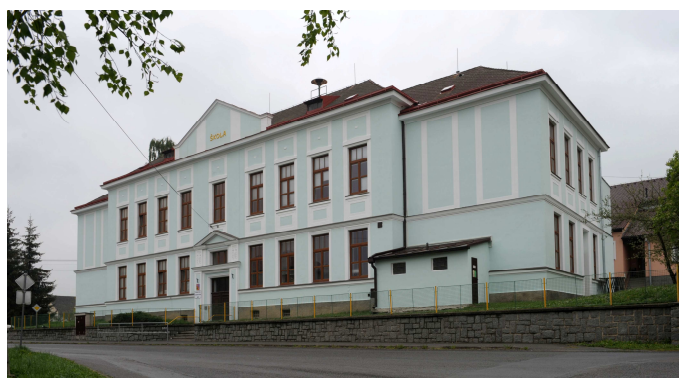
foto: Měčínská škola slaví 100 let