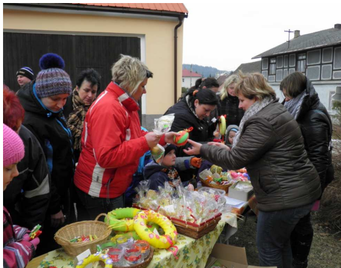
Velikonoční jarmark – sobota 23. března 2013