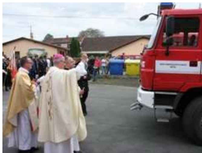
Obr.: Oslavy sv. Floriána

Do kulturní oblasti je za rok 2012 možné počítat stavění a hlídání májky, uspořádání májové zábavy s průvodem po městě, spoluorganizace a účast na oslavách sv. Floriána, kterých se osobně zúčastnil plzeňský biskup monsignor František Radkovský. Dále uspořádání akce na ukončení prázdnin s mnoha soutěžemi a odměnami pro děti. Rovněž jsme se ve spolupráci s kulturní komisí podíleli na zajištění čertovského reje. Do kulturní oblasti je nutné zahrnout i návštěvy při kulatých oslavách narozenin našich zasloužilých členů.