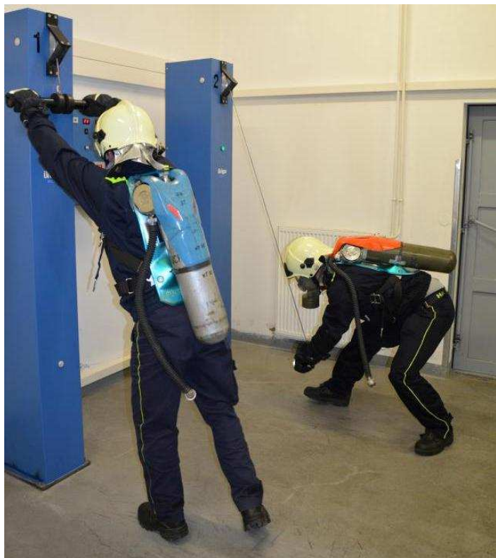
Obr.: Výcvik nositelů dýchací techniky

Velice důležitou oblastí naší činnosti je oblast preventivně výchovná. Zde si uvědomujeme, že máme co zlepšovat. Preventivní činnost jsme projednávali na našich schůzích, ale nepodařilo se nám zorganizovat akce pro veřejnost zaměřené právě na prevenci proti požárům. To jsme chtěli napravit hned počátkem roku letošního. Proto jsme ve spolupráci s HZS Klatovy zorganizovali přednášku pro naše spoluobčany dne 22.3.2013 v klubovně SDH. I když tato přednáška byla velmi zajímavá a poučná a byla zaměřena hlavně na možnosti vzniku požárů v bytech, dílnách, kůlnách a garážích, i na další rizika spojená s požárem a jeho případným neodborným hašením, nesetkala se se zájmem veřejnosti. Kromě členů SDH Měčín se této přednášce zúčastnili pouze dva ostatní občané.