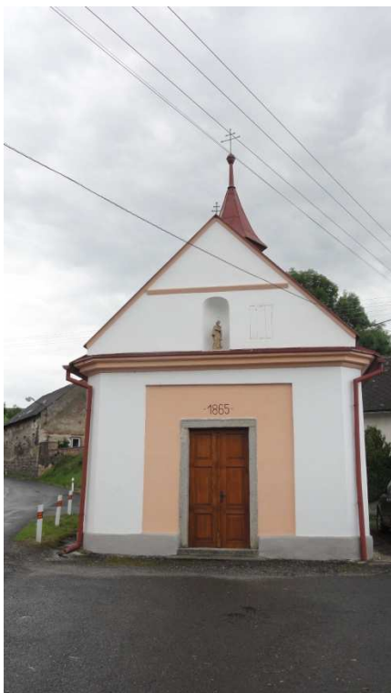
foto: Nedanice, kaplička – oprava fasády a výměna střešní krytiny