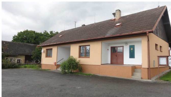
foto: Nedanice, společenské zařízení – oprava fasády a výměna oken a dveří