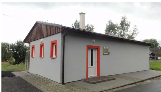
stavba nové klubovny SDH, volební a společenské místnosti