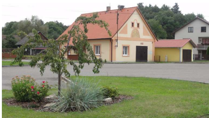
foto: Petrovice – nová fasáda, výměna střešní krytiny u hasičské zbrojnice s volební místností