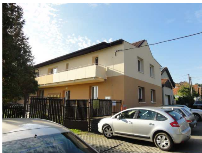
foto: Měčín – Dům s pečovatelskou službou – výměna oken, dveří, zateplení, nová fasáda