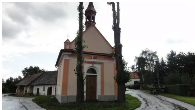
foto: Třebýcina, kaplička – oprava fasády a výměna střešní krytiny