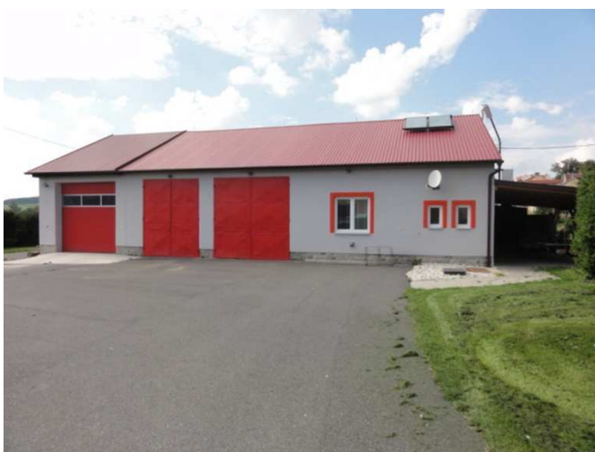
foto: Měčín – kompletní rekonstrukce hasičské zbrojnice, klubovny a přístavba garáže