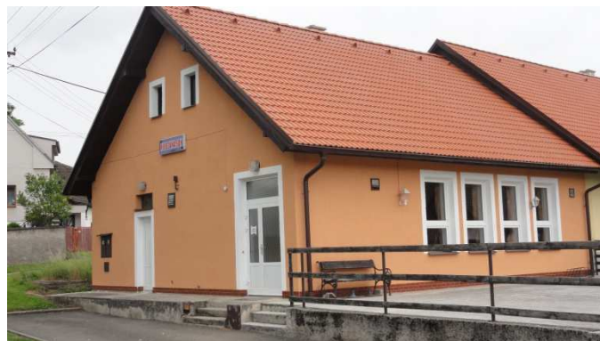
foto: Petrovice – rekonstrukce výměna oken a dveří, střešní krytiny klubovny SDH