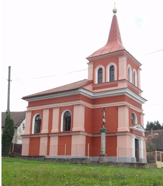
kaplička – oprava fasády, výměna střešní krytiny, klempířské práce